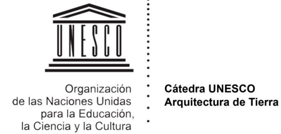
Cátedra UNESCO. Arquitectura de Tierra, Culturas Constructivas y Desarrollo Sostenible