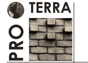
Red Iberoamericana de Arquitectura y Construcción con Tierra