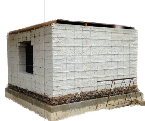
Aislamiento sísmico de vivienda rural con shicras