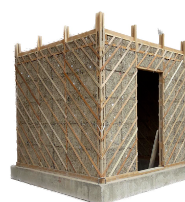
Nuevas experimentaciones Madera + tierra alivianada