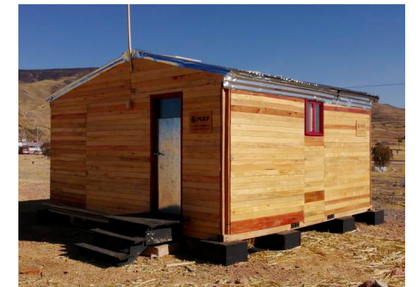
Vivienda Temporal Altoandina Madera + totora