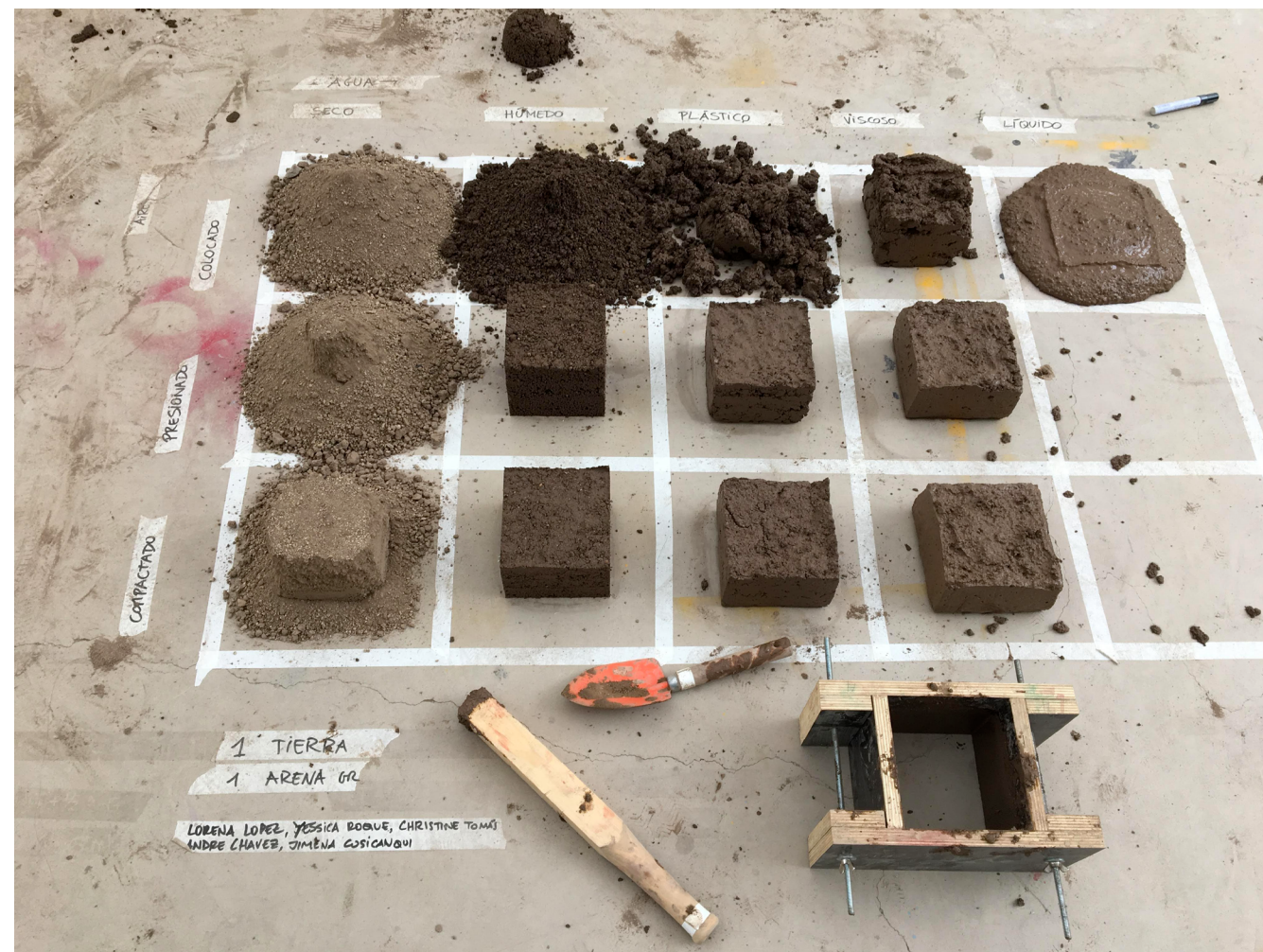
1 Acercamiento al material: el Test Carazas en el patio 103.