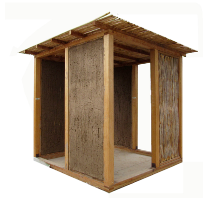
Desempeño térmico y acústico de la quincha